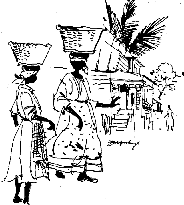
Steffen Linvalds bog er illustreret med yndefulde stregtegninger af Ingvar Zangenberg.