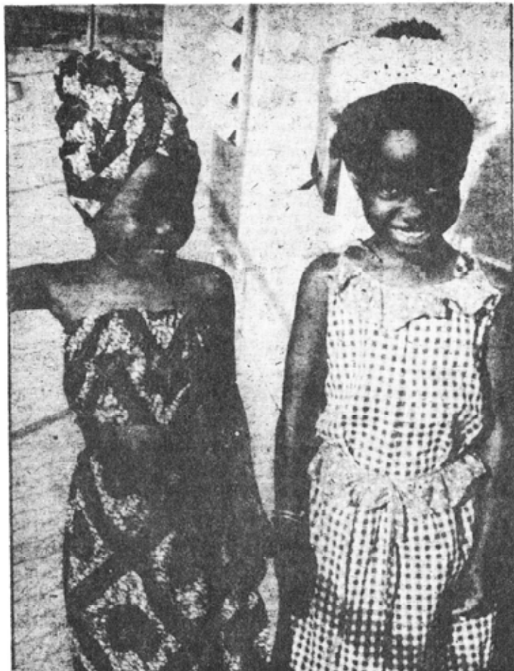
TWO YOUNG MODELS at a model Day Care Center in Cruz Bay, St. John recently entertained more than 50 persons at a fashion show held as part of open house activities at the Day Care Center operated by the Dept. of Social Welfare. Styles and smiles of the models won warm applause.