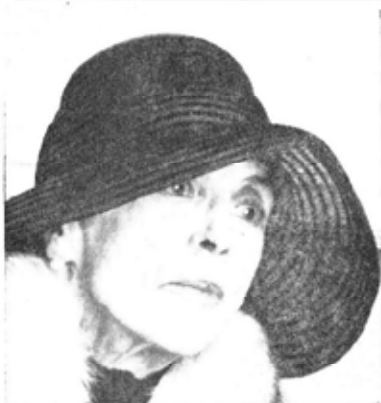
Karen Blixen (Isak Dinesen) 1885-1962

Moltkes Pale (Håndværkerforeningen), Dronningens Tværgade Fredag den 6. oktober 1972 kl. 20