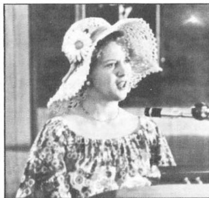
Dronning Margrethe holder tale i "Legislature" - billedet er fra regeringens eget oplysningsblad i 1976

Højlandet. Alle lystbådene. Det gamle danske Fort Christian om bagbord. Emancipation Garden og den grønne bygning, hvor regeringen holdt til og foran på pladsen den flagstang, hvor "Dannebrog" blev nedhalet 31. marts 1917, og de sidste danske militærfolk sejlede hjem med "Valkyrien".