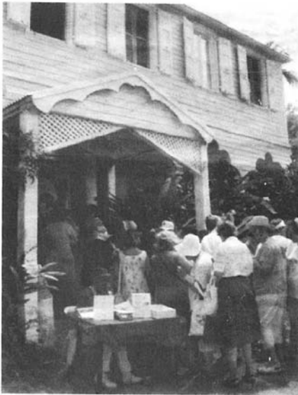
Der var trængsel ved indgangen til Lawaetz-familiemuseet.

After 250 years of Danish rule, the islands were acquired by the U.S. on March 31, 1917 for $25 million, putting an end to Denmark's hold on St. Croix, St. Thomas and St. John. But the association of the Islands' people with the Danish people is still strong 82 years after the transaction.