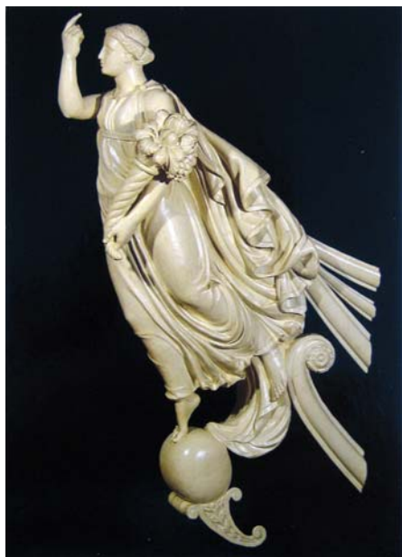
fig.4: Gallionsfiguren fra korvetten Fortuna . Orlogsmuseet.

et inden de sendtes videre til godkendelse hos kongen 4 . Studerer man nøje gallionen på korvetten, har den en umiskendelig lighed med en tegning i Rigsarkivets samling, der gengiver konstruktionskammerets forslag til gallionen på korvetten Fortuna 5 . Denne tegning bærer en påskrift, der lyder således: "Ornamenterne paa Korvetten Fortuna blev ei udført efter denne Tegning, da Kunst-academiet proponerede at synke den venstre Arm" 6 . Da det jo på Akademiet var Eckersberg, der påtog sig disse opgaver, må det være ham, der har været ansvarlig for ændringen. Skibet blev søsat i 1825 og vi er så lykkelige, at gallionen i form af lykkens gudinde Fortuna er bevaret 7 (fig.4). Den approberede (god-