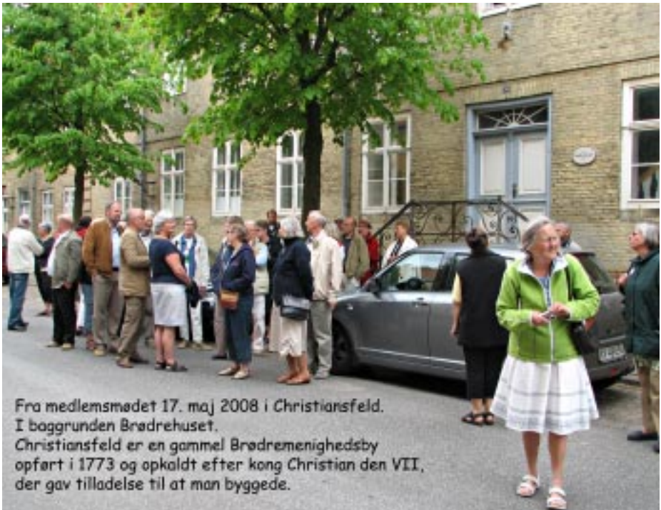
Fra medlemsmødet 17. maj 2008 i Christiansfeld. I baggrunden Brødrehuset. Christiansfeld er en gammel Brødre­menighedsby opført i 1773 og opkaldt efter kong Christian den VII, der gav tilladelse til at man byggede.

Danish Westindian Society Protector: Hendes Majestæt Dronningen