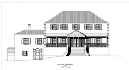
Sion Farm Greathouse