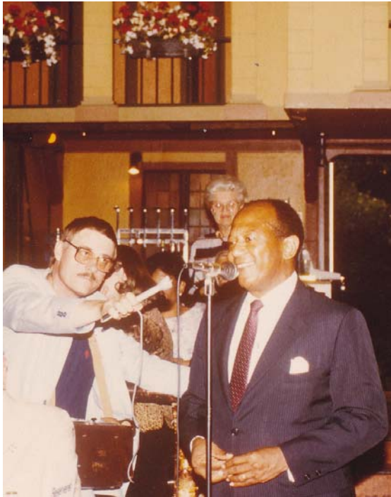
Ambassadør Terence Todman under Festival 1985

Deadline for artikler til blad 2014-5: 1. november 2014