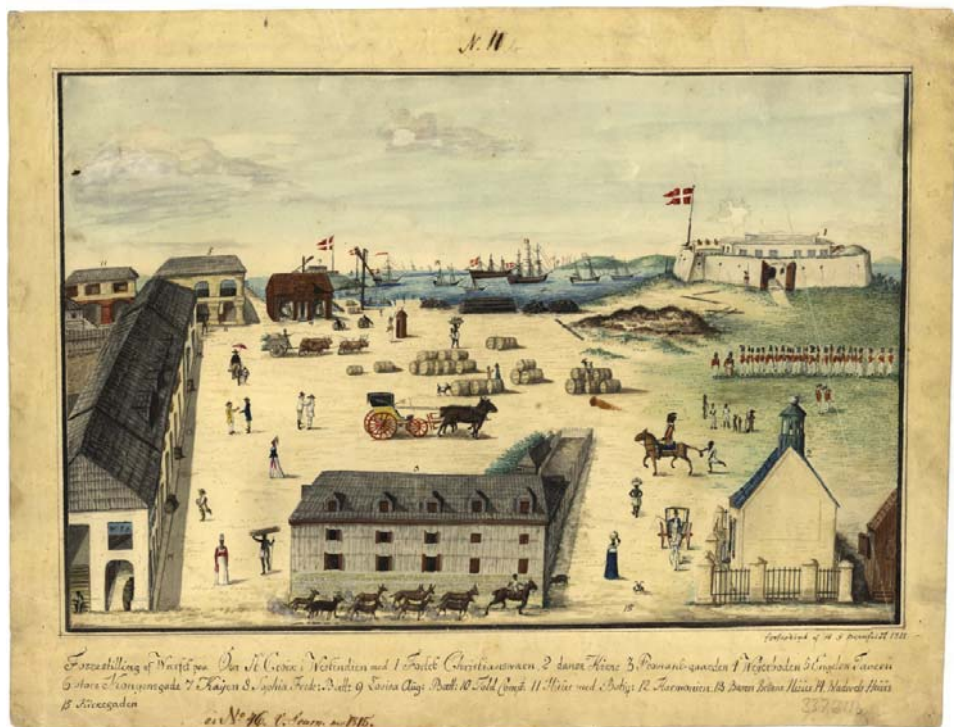
Den travle havneplads i Christiansted på St. Croix 1815 med sukkertønder parat til udskibning. Øverst til højre er Fort Christiansværn, dernæst følger kirken, kompagniets gård, en række byejendomme og den lille brune vejer-bod.

arkivalier kan scannes med forsigtighed, men at de øvrige skadede papirer kræver egentlig konservering. Dette sidste er uhyre dyrt - og det er der ikke umiddelbart penge til i det aktuelle tilgængeliggørelsesprojekt.