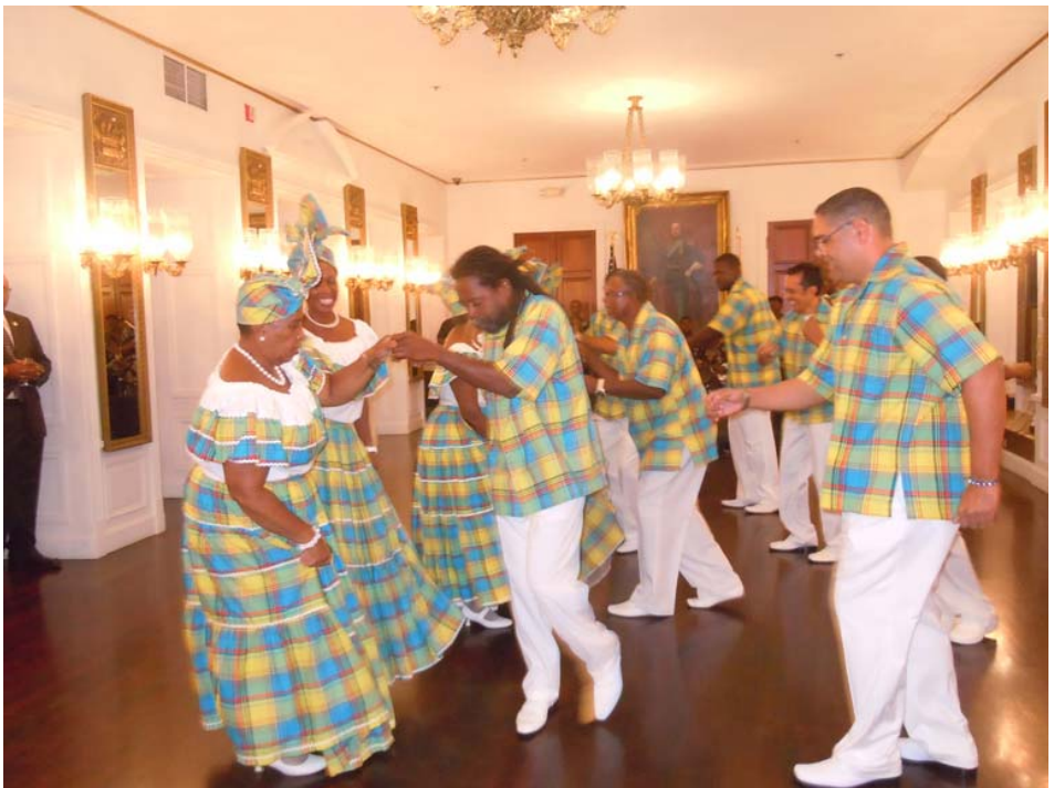
Kvadrilledans, Government House

Deadline for artikler til blad 2015-2: 1. marts 2015